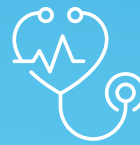
Medizin- und Labortechnik