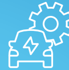
E-Mobilität und Sonderfahrzeugbau