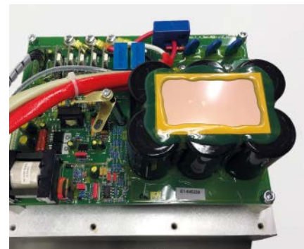
Das Kraftpaket – die Leistungsplatine

Weitere Produkte finden Sie unter www.muutron.de