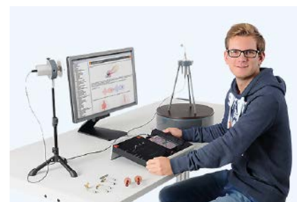
Lehrarbeitsplatz für Aus- und Weiterbildung

Weitere Produkte finden Sie unter www.muetron.de